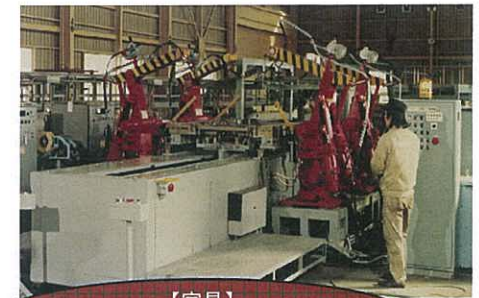
【家具】 ベッドフレーム溶接