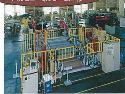
【住宅】 バルコニー床フレーム溶接