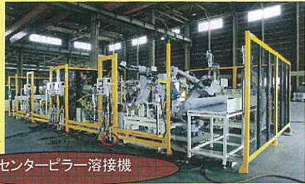
センターピラー溶接機