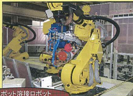
スポット溶接ロボット

自動車関連ではボディメインライン(及びサブ工程)、 フロアメインライン、建付けライン(ドア・トランク・フード ・フェンダーなどの組付けライン)、ドアライン・リアゲート ライン等の実績がございます。 自動車メーカー・部品メーカー共に多数実績あり。 3D CADに対応しております。