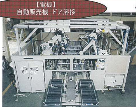
【電機】 自動販売機 ドア溶接