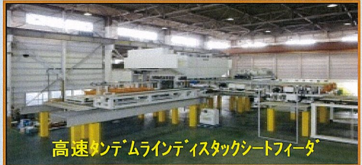
高速タンデムラインディスタックシートフィーダー

弊社技術の結晶 ディスタックシートフィーダー お客様の仕様にあわせさまざまなプランを 提供いたします。