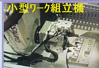
小型ワーク組立機