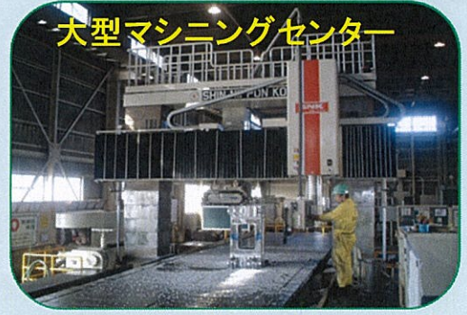
大型マシニングセンター

医療分野や食品分野への 経験と実績の応用！！ ノウハウ蓄積による他分野への応用！