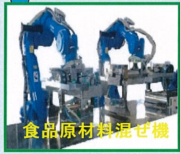
食品原材料混ぜ機