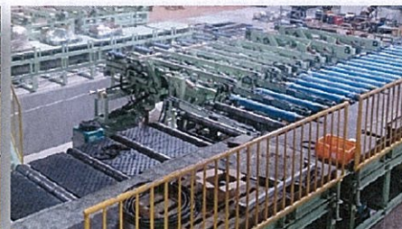
長物対応コンベア