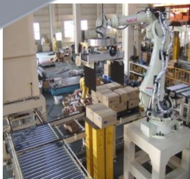
化学製品段積み装置