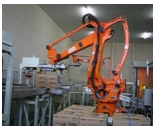
食品パレタイズ装置

ダンボールやパレット形状に合わせた ロボットハンドや、ワークに応じた パレタイズ・搬送方法をご提案します。