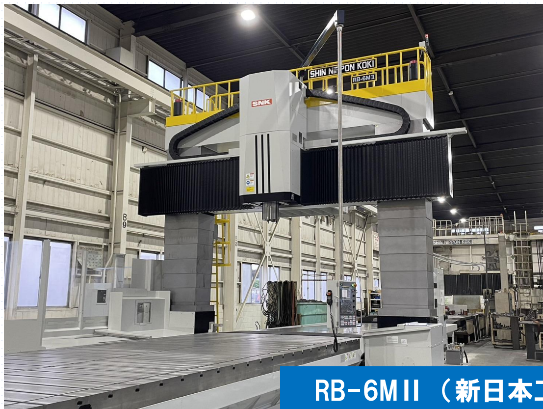
RB-6M II (新日本工機)

この度弊社では、お客様の更なるニーズに応えるべく 新たに 大型5面加工機 を導入しました。